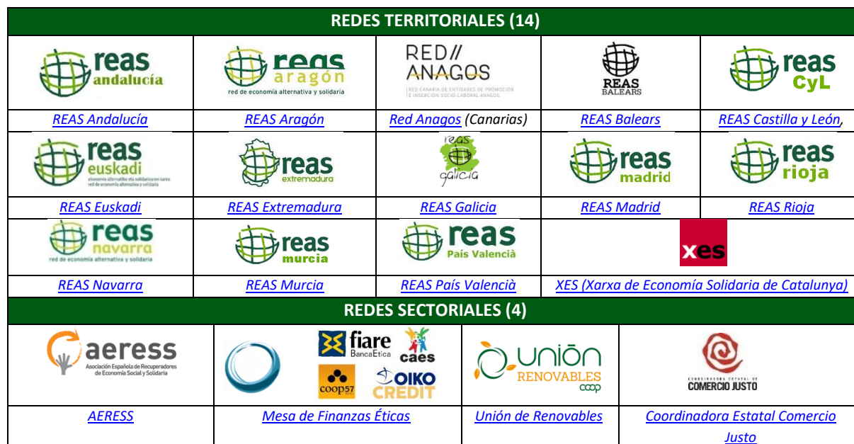
Cuadro 1.- Redes territoriales y sectoriales pertenecientes a REAS (2018)